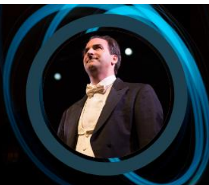
Direttore d'orchestra Art promoter